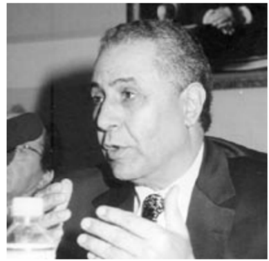
الدكتور مبارك ربيع

حزب الاستقلال قوة سياسية أساسية في المغرب المعاصر، هذه القوة تستمد حضورها ومكانتها من شرعية تاريخية، لأن الحزب من أقدم التنظيمات السياسية بالمغرب وشرعيته السياسية تمثلت في النضال من أجل الاستقلال وإقامة مجتمع ودولة ديمقراطيين. وإذا كانت هناك من قوة للمغرب فهي تأتي من وجود أحزاب حقيقة ذات مشاريع مجتمعية فعلية وذات تجذر في المجتمع المغربي.