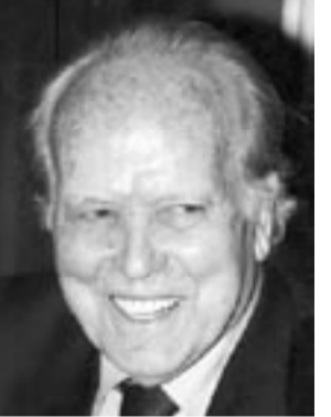
الدكتور عبد الهادي التازي:

× لا بد ان اقول انه حين يتولى أمين عام حزب من الأحزاب رئاسة الحكومة يجد نفسه في وضع قائد الأغلبية ولأول مرة يجد حزب الاستقلال نفسه في هذه الوضعية الريادية والقادية، هذا ما يجب ان أسجله لاستناد عباس الفاسي. هو كوزير اول في الفهم الديمقراطي رئيس للأغلبية الحالية، ولهذه الرئاسة مسؤوليات سياسية وأخلاقية جسيمة وبالتالي فحزب الاستقلال اليوم هو حجر الزاوية في المشهد السياسي الوطني.