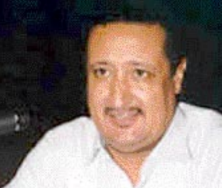
الدكتور عبد الصمد بلكبير

في رأيي انه يجب ان توضح الأمور في ظل هذه المرحلة الدقيقة من تحولنا الديمقراطي وخاصة فيما يتعلق بالإصلاحات الدستورية والسياسية. هذا جزء مما نتظره من حزب الاستقلال الذي تمنى له النجاح والتاريخ اظهر دائما أن مؤتمرات حزب الاستقلال كانت ناجحة، ونتمنى ان تجتمع القوى الديمقراطية واطن انه إذا ما أعيدت صياغة الكتلة فإن موقعنا هو مع القوى الديمقراطية وذلك من أجل مصلحة البلاد.