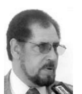
الدكتور محمد مصطفى القباج

علينا ان نعلم ان حزب الاستقلال هو الحزب الوطني الأوحد الذي كان في المغرب إبان مرحلة الحماية، وكانوا جميع الوطنيين ينتسبون إلى حزب الاستقلال، وقلة منهم انتموا إلى حزب الشورى والاستقلال، فيما بعد سوف تنطبق في الساحة المغربية اتجاهات وأهواء سياسية مختلفة، لكن يبقى حزب الاستقلال هو قديم الأحزاب السناسية بدون منازع ورموزه الوطنيين كثر قطي سبيل الذكر، هناك علال الفاسي، وأحمد بلافريرج، وأبو بكر القادري وغير هؤلاء الذين يعتبرون رموزاً لجميع المغاربة بدون استثناء.