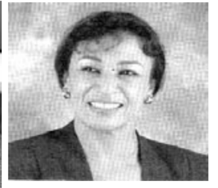
الفنانة نزهة الركراكي:

إنها مرحلة تبهير بإشعاعها بقدر ما تلقي بظلها على حزب الاستقلال والأحزاب الوطنية المغربية الأخرى. وشيء آخر يحط بكله على أي تنظيم وطني حقيقي، وبالتالي على حزب الاستقلال، وأعني هنا مواصلة الوعي والكفاح في سبيل دعم وحدتنا الترابية، إنها مع شديد الأمل، ما فقتت لقي عنادا وبسائس ومناورات، وأكد ان هذه القضية تأتي في طليعة اهتمامات المناضلين.